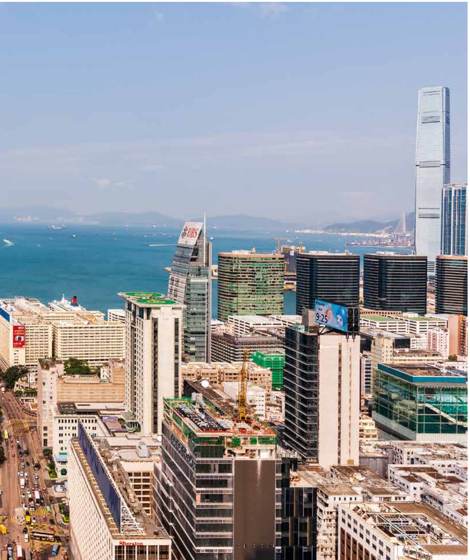
This is a view you won't see anywhere else: The terrace of the executive lounge on the 40th floor of the Rosewood Hong Kong offers unrivalled views of the harbour, the Hong Kong Museum of Art and the skyline of Central.