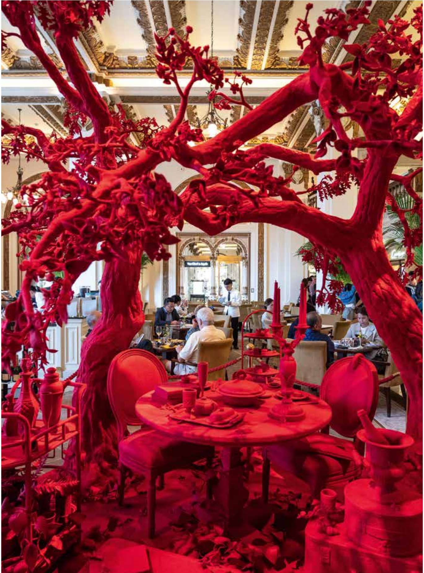
Rote Wunderwelt: Die beeindruckende Installation von Timothy Paul Myers in der Lobby des Hotels The Peninsula gehört zum neuen mehrjährigen «Art in Resonance»-Programm der exklusiven Hotelgruppe.