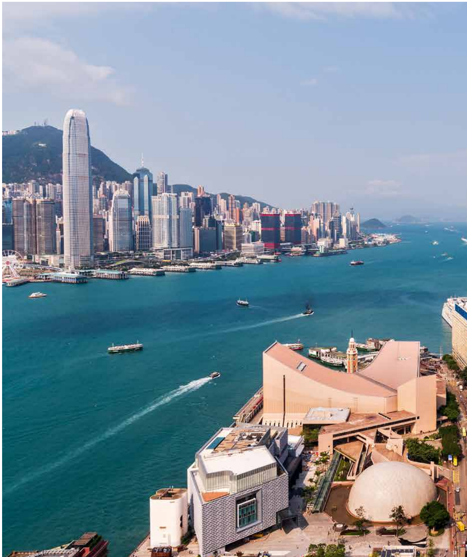
Diesen Ausblick gibt es nur einmal: Von der Terrasse der Executive Lounge im 40. Stock des Rosewood Hong Kong ist der Blick auf den Hafen, das Hong Kong Museum of Art und die Skyline des Stadtteils Central schlichtwegs unschlagbar.