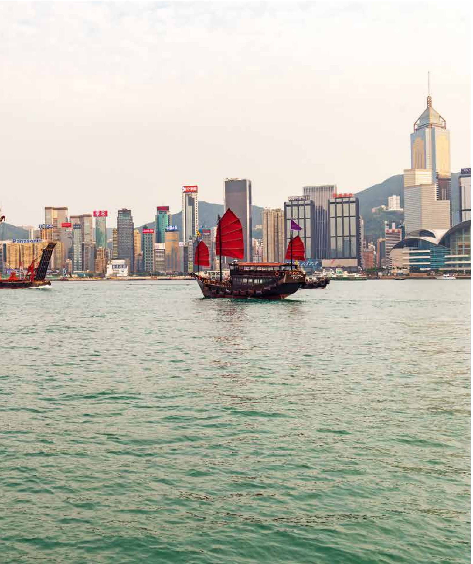
Taking it all in: Gazing out onto the water and the red Aqua Luna junk from the newly developed Victoria Dockside district is pure pleasure.