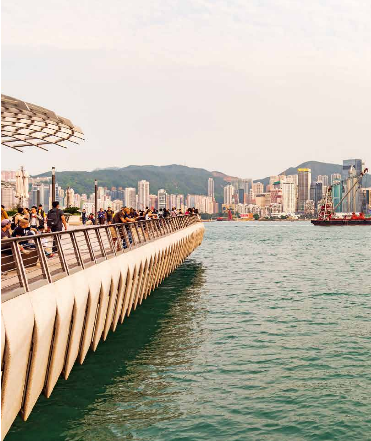
Romantische Stimmung: Von der neu gestalteten Victoria Dockside ist der Blick übers Wasser und auf die rote Aqua-Luna-Dschunke ein wahres Vergnügen.